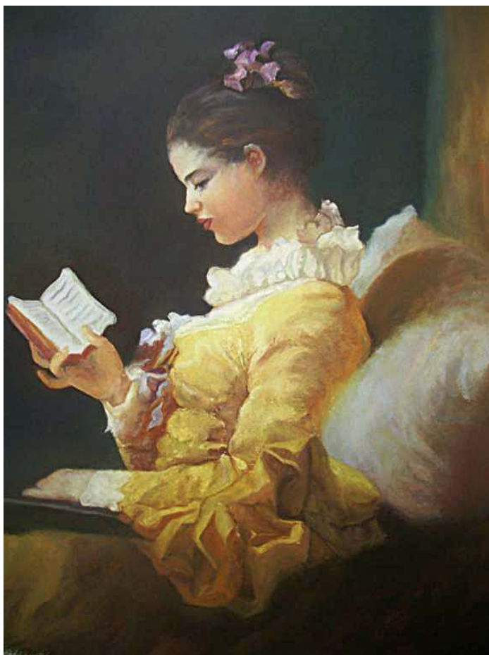
Joven leyendo (interpretación J. H. Fragonard)