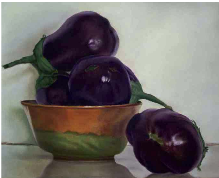
Berenjenas (interpretación Claudio Bravo)