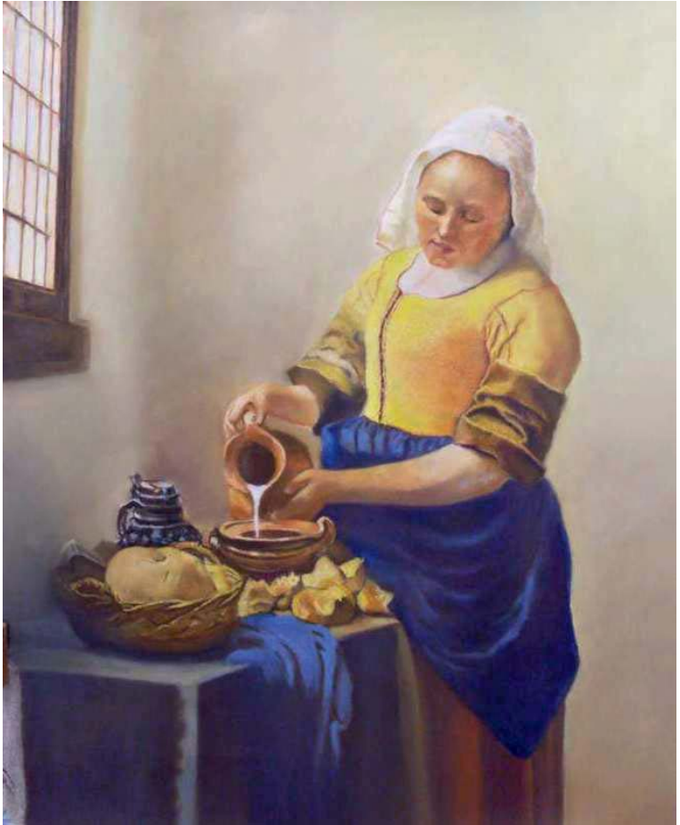
La lechera (interpretación Vermeer)